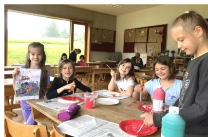
Teller einmal rot bemalt

Die große Turnhalle ist bei den Schulkindern in der Nachmittagsbetreuung sehr gefragt. Gemeinsame Ballspiele oder auf rasenden Rollen mit „vollbiologischem“ Motor durch die Halle sausen: Hier können sich die Kinder nach dem Lernen nach Lust und Laune bewegen.