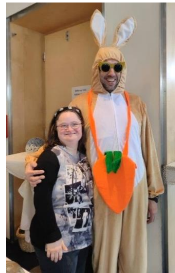
Besuch vom Osterhasen