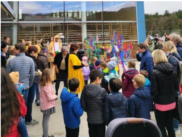
Die Kinder präsentierten stolz ihre Kunstwerke

Hier einige Eindrücke von der Oster-Veranstaltung: