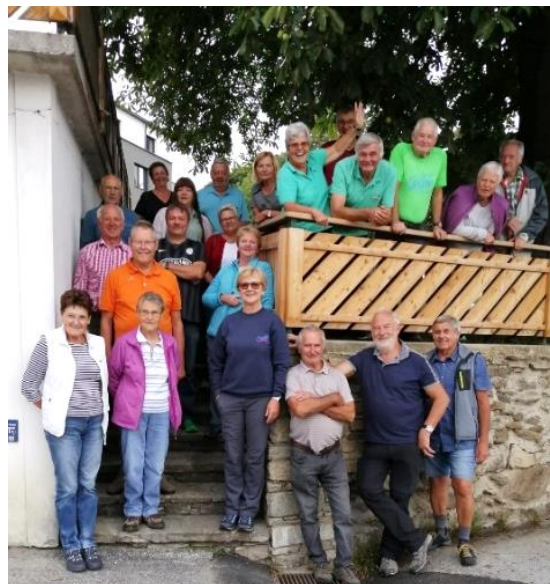
Beim Gasthaus Schrank nahe Stubenberg am See