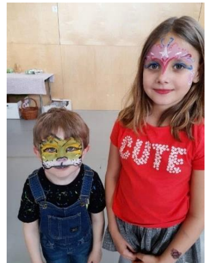
Auch das Kinderschminken wurde gut angenommen.