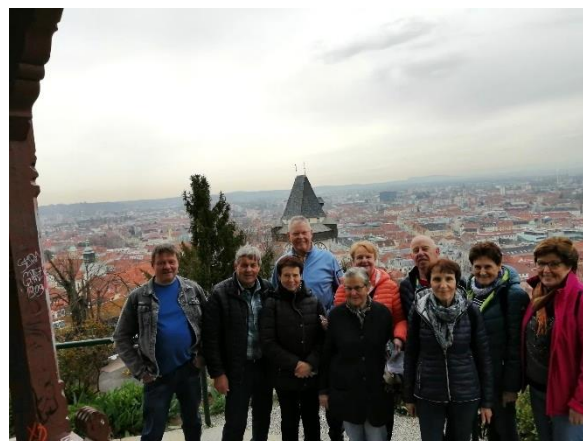
Ausflug zum Schloßberg und in den Stadtpark

Der nächste Wandertag ist am Donnerstag, 27. Juli 2023