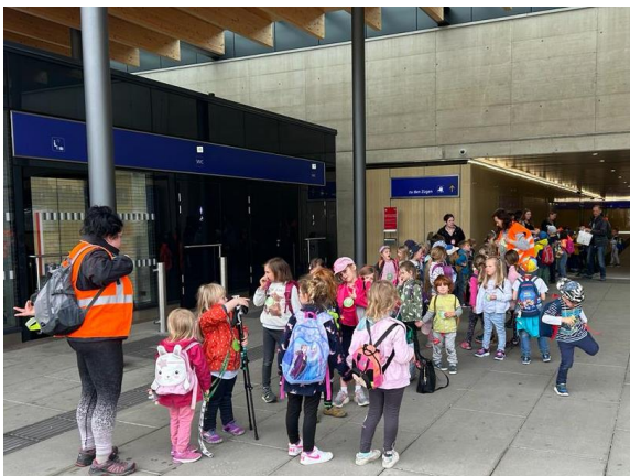
Am Bahnhof in Frohnleiten wird schnell noch einmal durchgezählt.