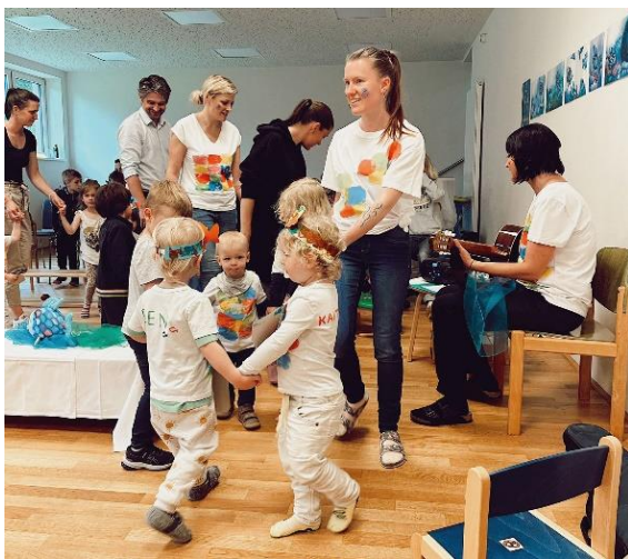
Begeistert tanzten die Kleinen der Sonnengruppe zum Regenbogenfisch-Lied.

Ein eigenes „Regenbogenfisch-Lied“ wurde einstudiert und ein Tanz geprobt. Beim Sommerfest wurde mit Gitarrenbegleitung begeistert gesungen und getanzt. Wir freuen uns auf noch viele fröhliche Feste beim Piepmatz.