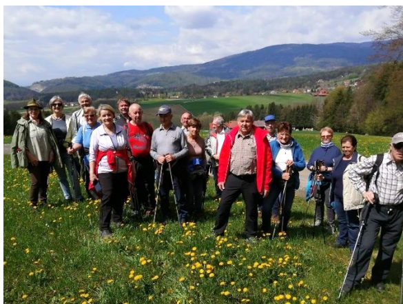
Beim schönen Miesenbacher Wanderweg