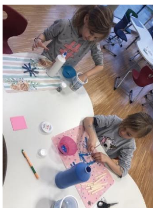
Malen in blau

Glattes Holz, viel bunter Glitzerstaub und knallige Farben werden zu großartigen Kunstwerken zusammengefügt. Langeweile hat hier keine Chance.