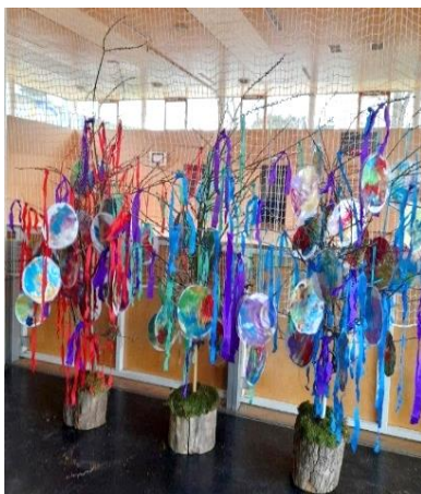
Die Ostersträucher der Kinder