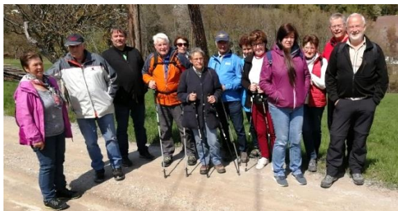
Von der Ortsmitte Sankt Radegund bis zum Kreuzwirt. Bild unten: „St. Johann und Paul“

Hier ein paar Eindrücke von früheren Wanderungen: