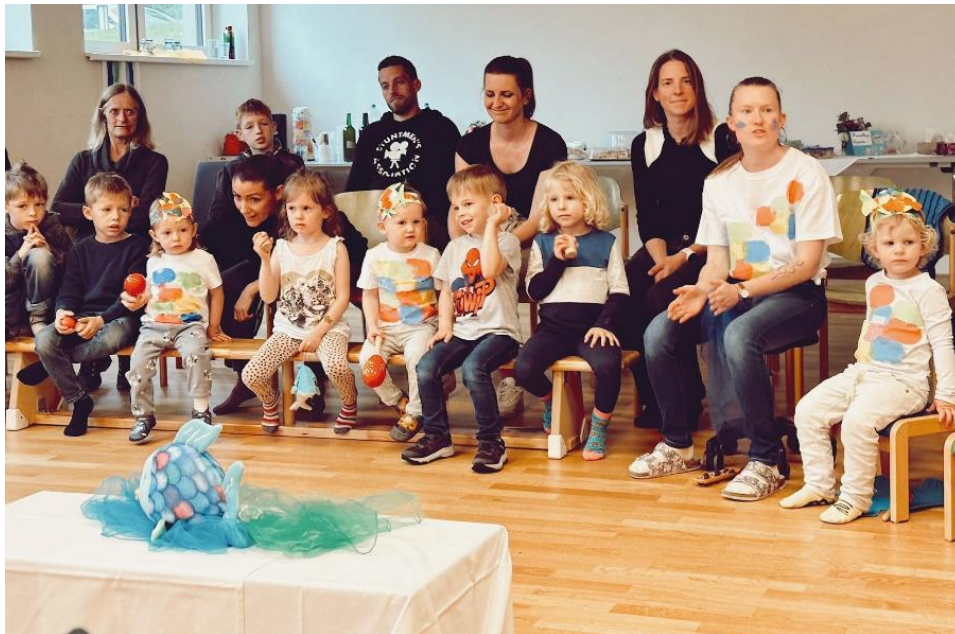
Sonnengruppe – Sesselkreis

Die vielen Vorbereitungsarbeiten haben sich ausgezahlt. Das Sommerfest der Kinderkrippe Weinitzen ist gelungen: