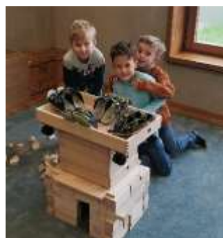
Elias, Vali und Tobias, die neuen Design-Experten für Patschenablagen.