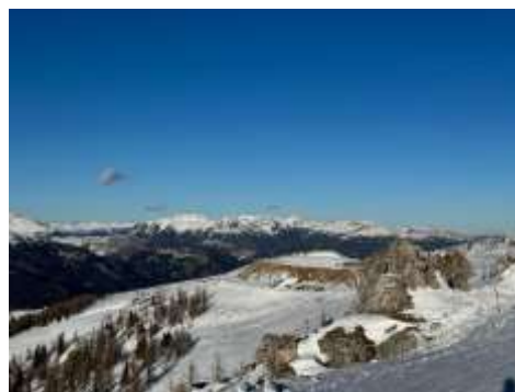
Ab auf die Piste!

Ende Jänner sind wir dann gemeinsam zu unserem Ski- und Thermentag nach Bad Kleinkirchheim aufgebrochen. Die verschneiten Pisten, die frische Bergluft und die warmen Thermalquellen haben nicht nur uns Musikerinnen und Musiker, sondern auch unsere Familien und Helferinnen und Helfer begeistert, die uns begleitet haben. Der Ausflug war eine wundervolle Gelegenheit, um neue Energie zu tanken und den Blick nach vorne zu richten.