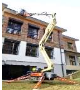
Foto rechts: Installation des neuen Notstromaggregats beim Gemeindeamt Weinitzen

Im Krisenfall kann das Gemeindeamt durch diese Maßnahme auch als zentrale Anlaufstelle für die Bevölkerung dienen.