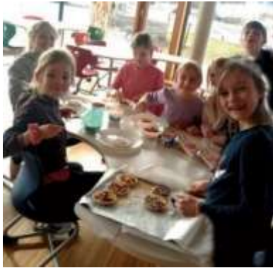
Kocheinheit in der „Nachmi“