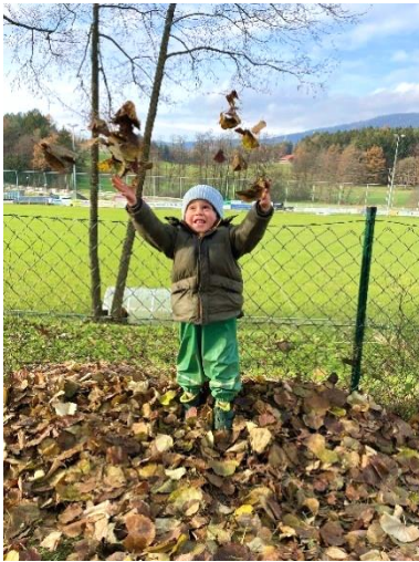
Mit Laub lässt sich im Kindergarten herrlich spielen.

Natürlich kann man im großen Garten beim Kindergarten Weinitzen herrlich spielen und die Natur entdecken. Noch viel besser geht das aber auf einem Spaziergang in die Umgebung. Auf solchen Ausflügen kann die Umgebung genau erkundet werden. Mit Ästen und Zweigen lassen sich herrliche „Lager“ bauen. Verschiedenste Naturmaterialien wurden gesammelt und die heimische Natur näher erforscht. Das gemeinsame Erleben lässt die Kinder ganz nebenbei zu einer Gemeinschaft zusammenwachsen. Ein großes Danke geht an die Waldbesitzer, die den Kindern dieses Erlebnis ermöglichen.