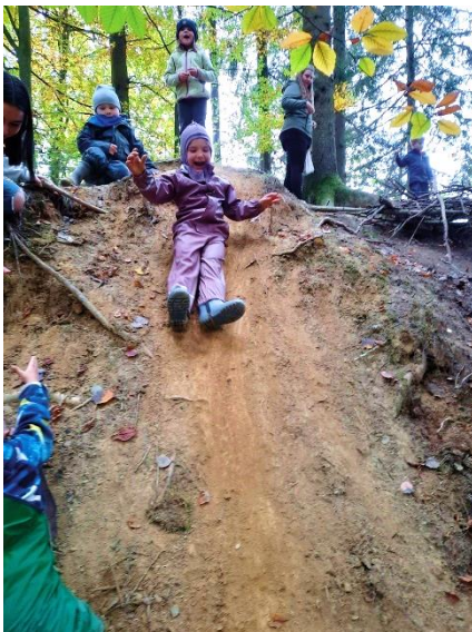
Das Foto zeigt, warum Kinder Gatschhosen brauchen.