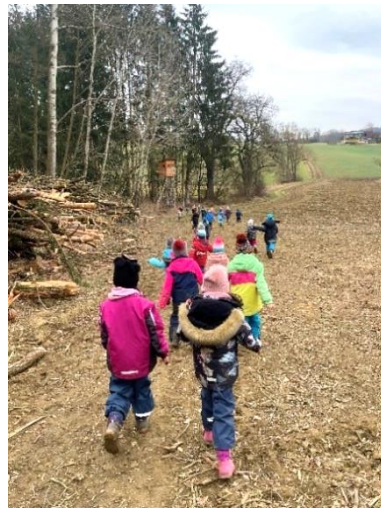
Ein Stückchen muss man schon laufen, um in den Wald zu gelangen.