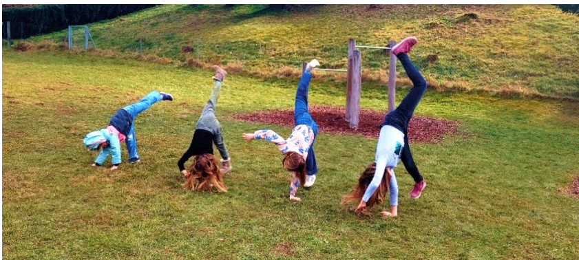
Bild links – Radschlagen: Die vier Mädels sind bereits GTS- Bewegungsprofis.

Die „Grobmotorik“ wird gerne draußen im Schulhof trainiert. Bewegung an der frischen Luft bietet einen willkommenen und wichtigen Ausgleich zum Lernalltag. Gemeinsam macht toben, turnen und spielen im Freien noch mehr Spaß.