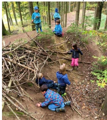
Bild rechts – Lagerbau In Teamarbeit funktioniert das Bauen eines Lagers besonders gut.