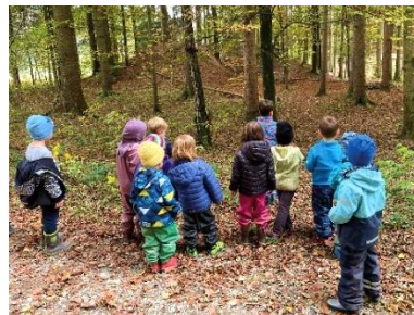
Die Natur beobachten und entdecken ist eines der Ziele der Waldspaziergänge.