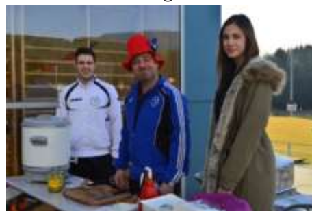
Für gute Bewirtung wurde gesorgt